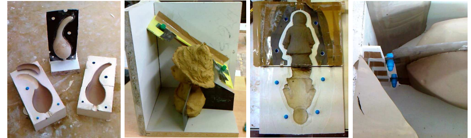
Maison / Céramique