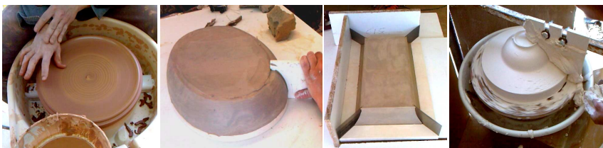
Maison de la Céramique de Dieulefit : stage 04/10 (autour de l'estampage).